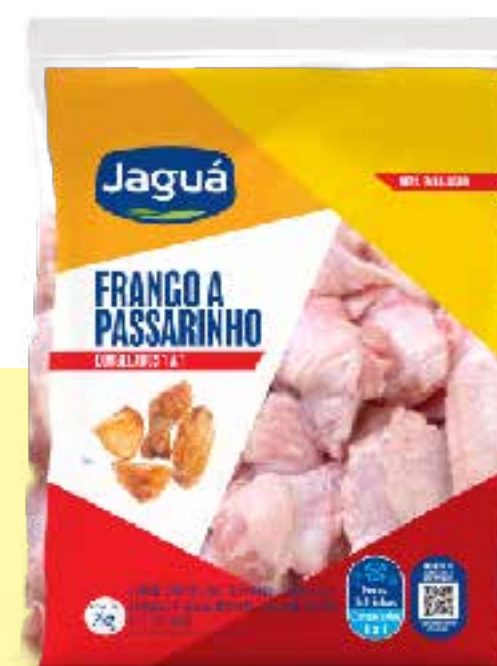
FRANGO A PASSARINHO Cód. do produto: 0010J Peso unitário: 2kg EAN: 7908643600522 DUN: 17908643600529