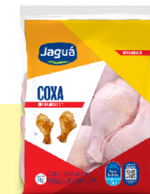
COXA Cód. do produto: 0213J Peso unitário: 2kg EAN: 7908643600539 DUN: 17908643600536