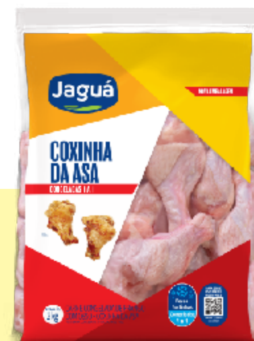
COXINHA DA ASA Cód. do produto: 0113J Peso unitário: 2kg EAN: 7908643600492 DUN: 17908643600499