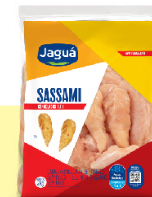
SASSAMI Cód. do produto: 0418J Peso unitário: 2kg EAN: 7908643600515 DUN: 17908643600512