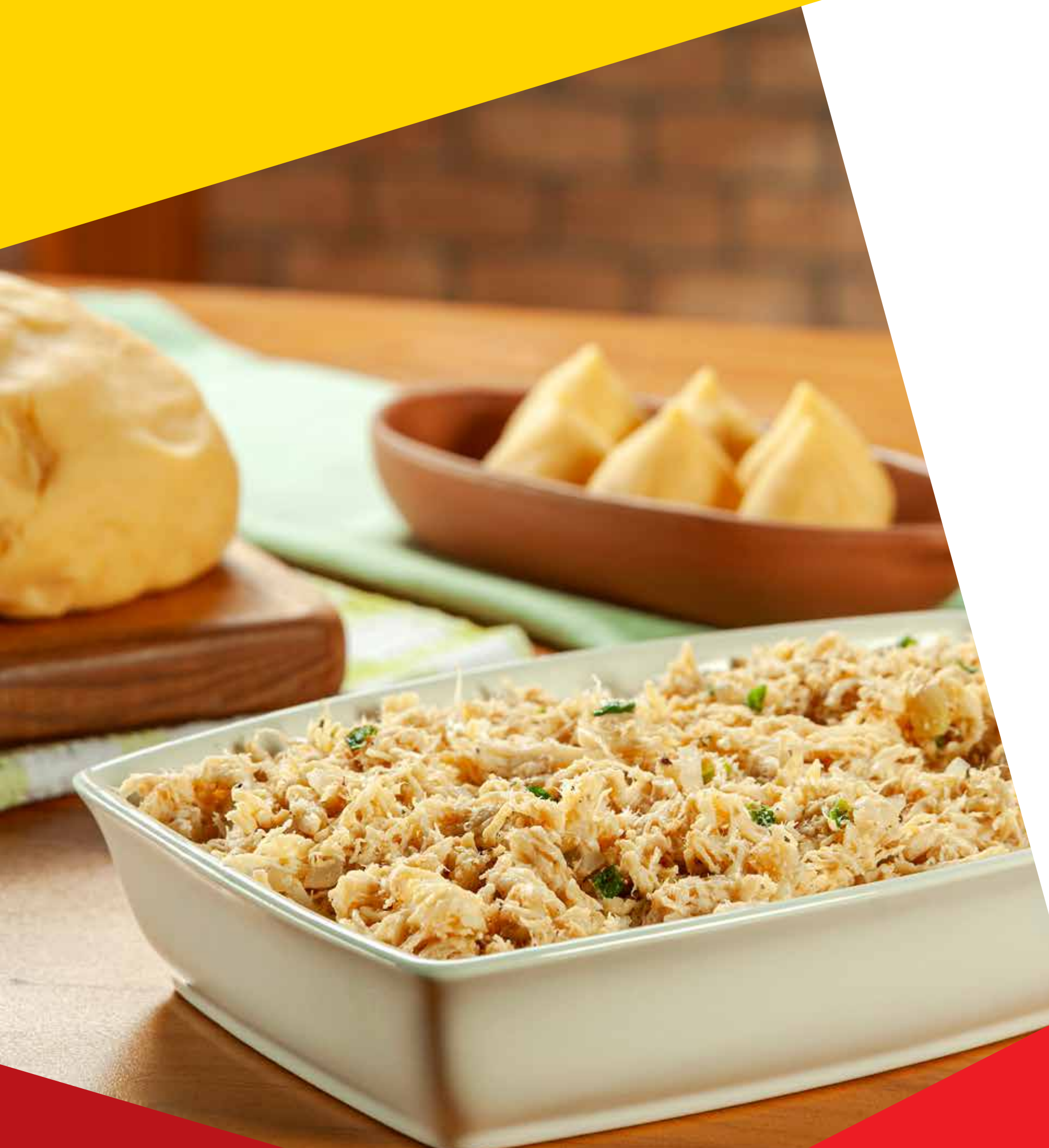
TABELA DE REFERÊNCIA