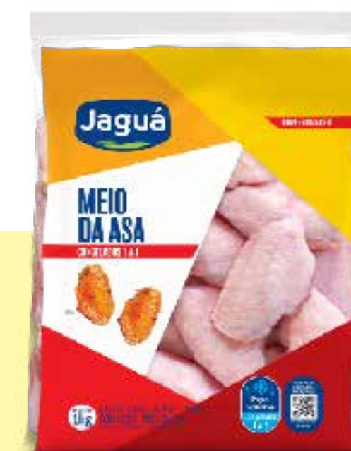
MEIO DA ASA Cód. do produto: 0114J Peso unitário: 2kg EAN: 7908643600508 DUN: 17908643600505