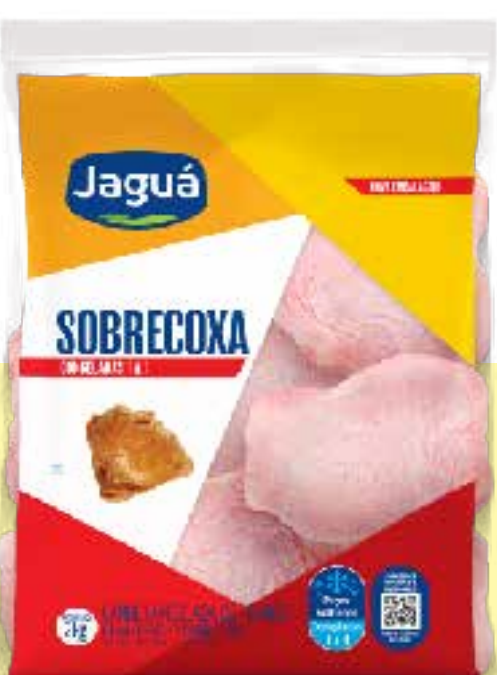
SOBRECOXA Cód. do produto: 0214J Peso unitário: 2kg EAN: 7908643600546 DUN: 17908643600543